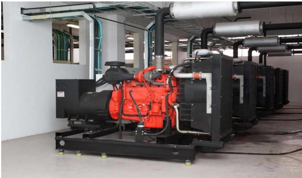
INSTITUTO BUTANTAN SÃO PAULO – FÁBRICA DE HEMODERIVADOS GRUPOS GERADORES